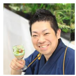
【てっちゃん先生 ポトリウム体験会】