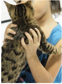
【ニャンコふれあいハウス】

犬・ネコ・魚・鳥・小動物・は虫類・昆虫たちが大集合した、ペットと暮らす喜びを体験できるコーナーです。ワンちゃんと遊べて、おさんぽ体験もできる「わんわん広場」や、猫ちゃんたちとふれあい、おもちゃを使って遊べる「ニャンコふれあいハウス」、カメレオンやフトアゴヒゲトカゲへの餌やり体験や、ゾウガメやイグアナとの記念撮影、ヘビの首巻き体験&撮影会などができる、 は虫類エリア 、ちょっと不思議で、撮影して楽しい「体験型インスタクアリウム」や、最強アクアリスト決定戦！「2017JPF カップ 水槽ディスプレイコンテスト in 大阪」が楽しめる 観賞魚エリア の他、世界のチャンピオンペットや珍種、人気のペットが勢ぞろいします。