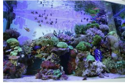
【水槽ディスプレイ】