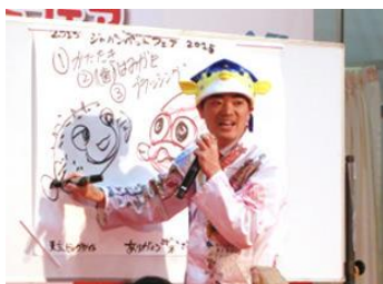
【さかなクン トーク&クイズ】

最終日には、最新ペット用品を業界関係者と一般来場者が人気投票し、それぞれが注目するナンバー1を決定する 表彰式 を開催します。