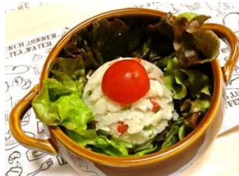
【磯谷いつ穂先生 Cooking 教室】